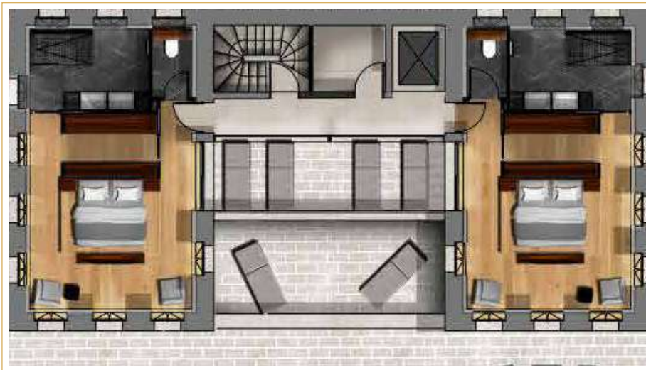
SUITE INDÉPENDANTE REZ DE JARDIN, ESPACE BIEN ÊTRE